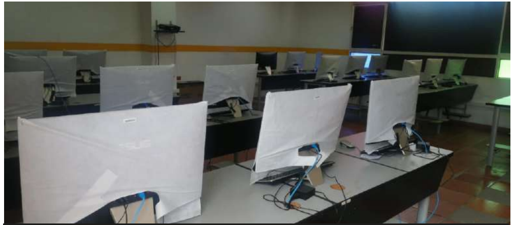
Centro Tecnológico de Cúcuta Salón 302

Recursos informáticos, bibliográficos, tecnológicos y de comunicación en el Centro Tecnológico de Cúcuta.