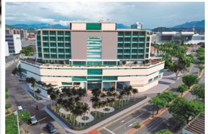
Clínica Materno Infantil Virgilio Barco